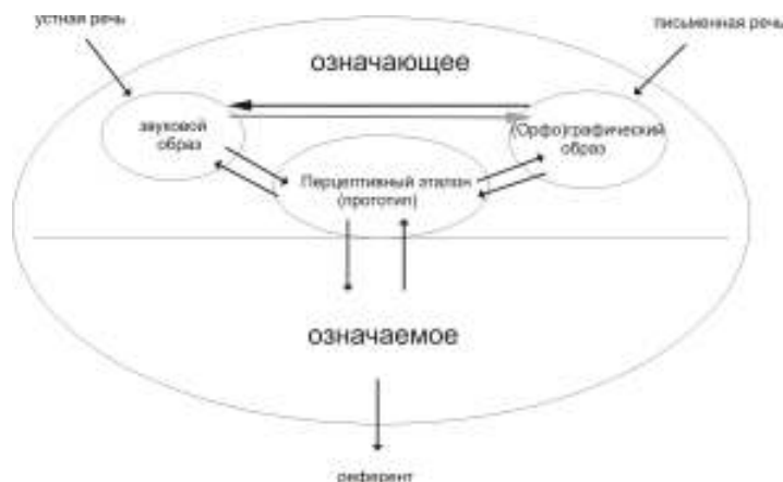
Рис.2. Внутренние связи языкового знака

Будучи парными и опосредованными перцептивным эталоном, разнонаправленные внутрисловные ассоциативные связи характеризуются состоянием неустойчивого равновесия. Изменение меры силы ассоциативных связей в зависимости от конкретных условий приводит к явлению «асимметричного дуализма» языкового знака (С.О. Карцевский).